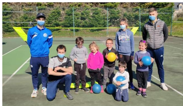
La reprise en plein air de l'école de volley à Saint Just.