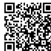
Tournage des vidéos pour le livre augmenté

Rentrée des classes le jeudi 2 septembre 2021