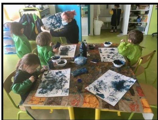
Réalisation des décors du livre